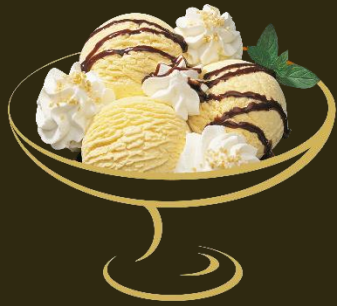
Danemark Vanille mit Schokoladensauce Fr. 12.50 Mini: Fr. 10.50