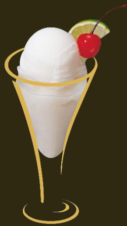
Le Colonel 2 Kugeln Sorbet Citron mit Vodka Fr. 12.50