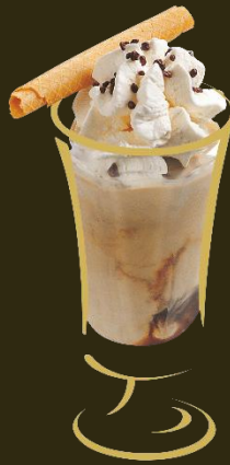
Café Glace Immer fein! (enthält Haselnusskrokant) Fr. 10.50 Mini: Fr. 8.50