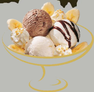
Bahia Banane, Chocolat Fr. 13.90 Mini: Fr. 10.50