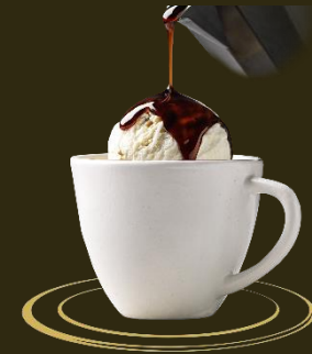
Affogato Mit Rahm Fr. 7.50