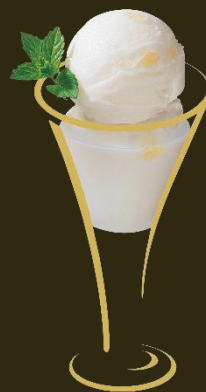
Kokos 2 Kugeln Kokosnussglace mit Malibu Fr. 12.50