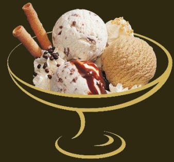
Stracciatella Stracciatella, Mocca Fr. 12.50 Mini: Fr. 10.50