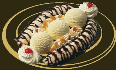
Banana Split Vanille mit Schokoladensauce Fr. 12.50 Mini: Fr. 10.50