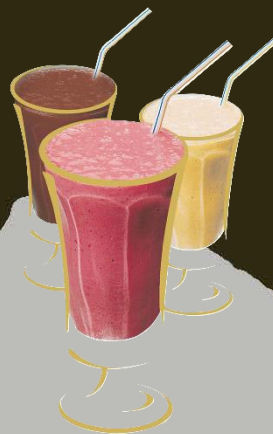
Frappé Aroma nach Wahl Fr. 8.50