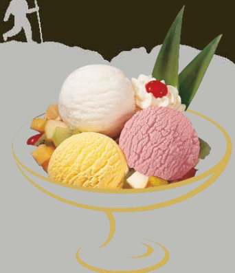
Sommertraum Kokosnuss, Himbeere, Mango Fr. 14.50 Mini: Fr. 10.50