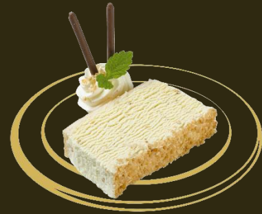
Glaceschnitte Nougat Fr. 8.90