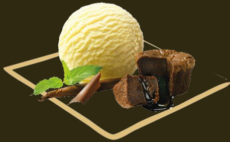
Schokotraum mit 1 Kugel Glace nach Wahl Fr. 12.50 ohne Glace mit Rahm Fr. 9.50